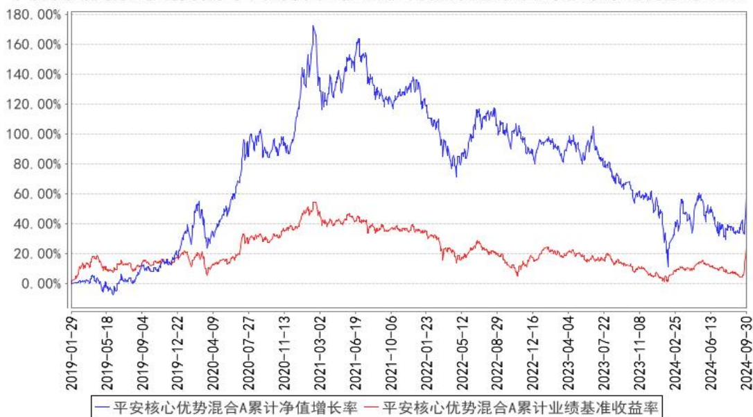
平安核心优势混合A累计净值增长率与同期业绩比较基准收益率的历史走势对比图