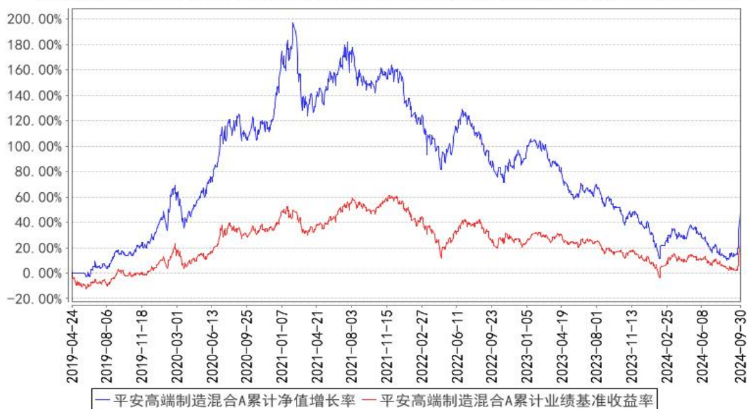
平安高端制造混合A累计净值增长率与同期业绩比较基准收益率的历史走势对比图