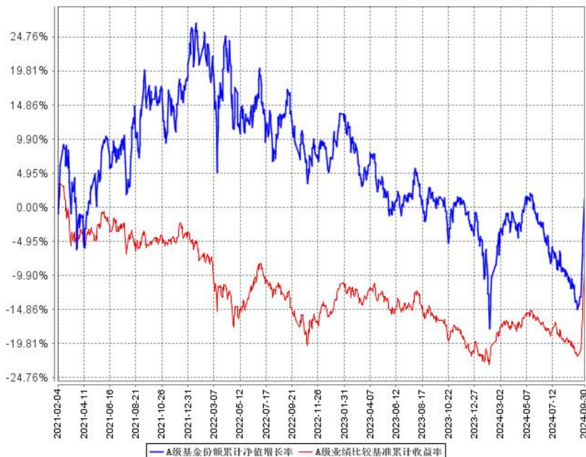
A 级基金份额累计净值增长率与同期业绩比较基准收益率的历史走势对比图