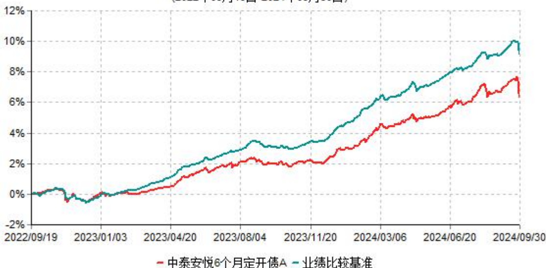
中泰安悦6个月定开债A累计净值增长率与业绩比较基准收益率历史走势对比图 (2022年09月19日-2024年09月30日)