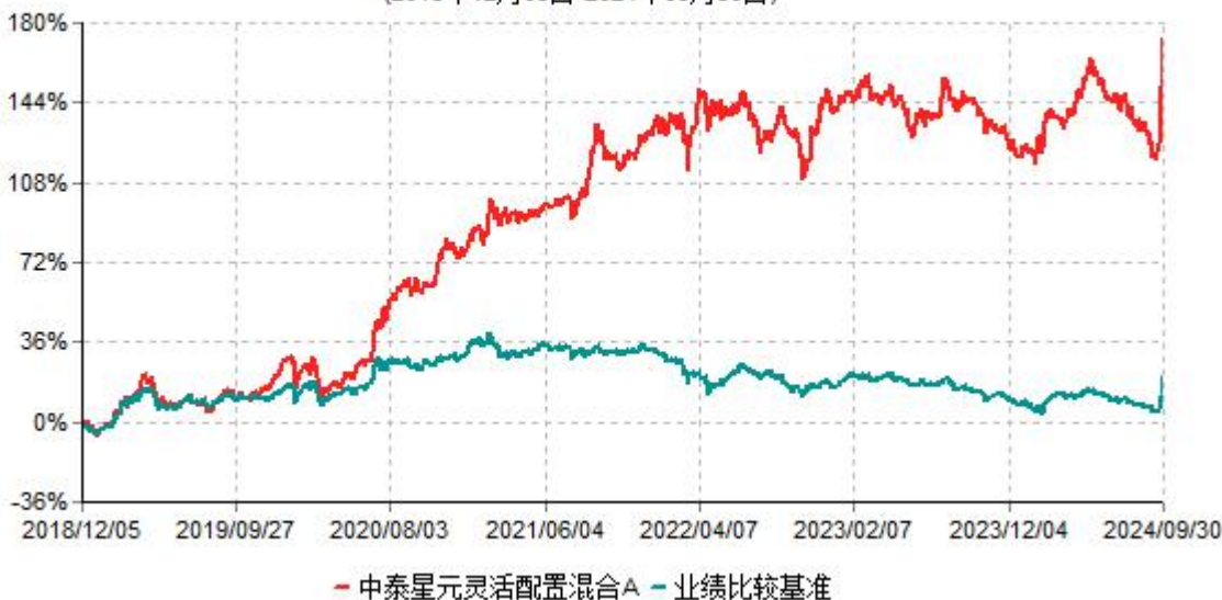
中泰星元灵活配置混合A累计净值增长率与业绩比较基准收益率历史走势对比图 (2018年12月05日-2024年09月30日)