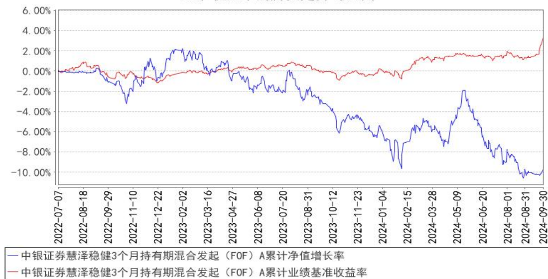
中银证券慧泽稳健3个月持有期混合发起（FOF）A累计净值增长率与同期业绩比较基准收益率的历史走势对比图