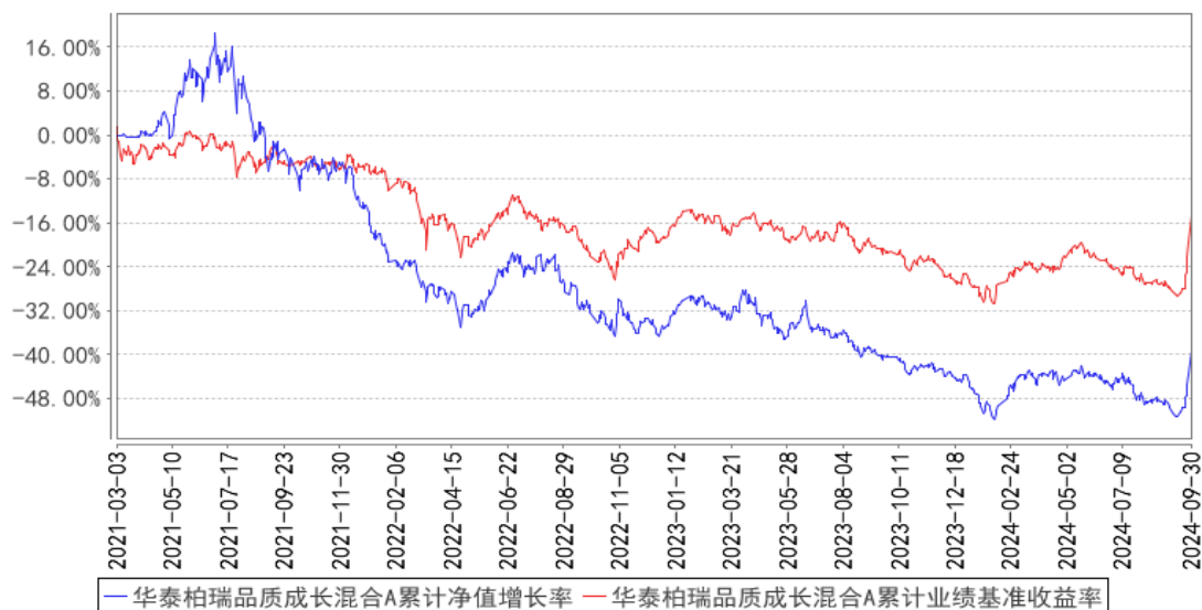
华泰柏瑞品质成长混合A累计净值增长率与同期业绩比较基准收益率的历史走势对比图