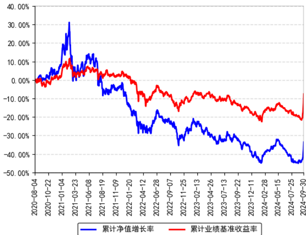
南方景气驱动混合A累计净值增长率与同期业绩比较基准收益率的历史走势对比图