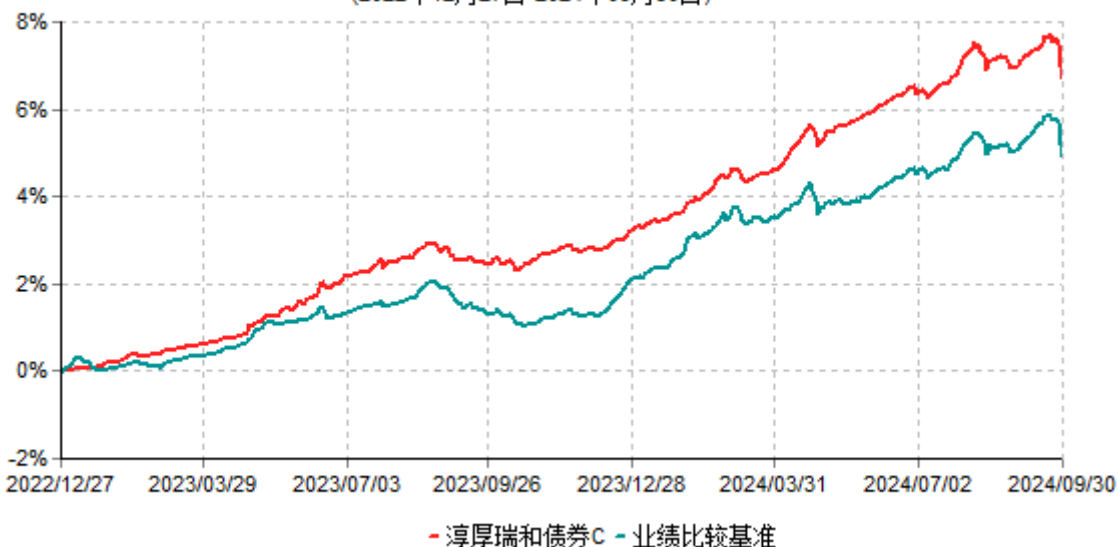
淳厚瑞和债券C累计净值增长率与业绩比较基准收益率历史走势对比图 (2022年12月27日-2024年09月30日)

注：本基金基金合同生效日为 2022 年 12 月 27 日。按基金合同规定，本基金自基金合同生效起 6 个月内为建仓期。建仓期结束时本基金的各项投资比例均符合基金合同约定。