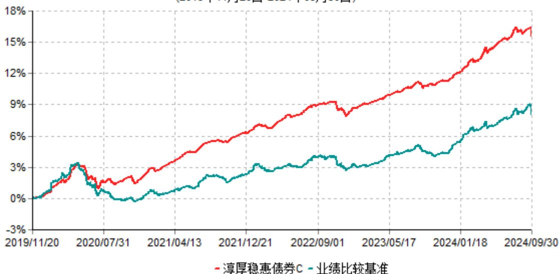
淳厚稳惠债券C累计净值增长率与业绩比较基准收益率历史走势对比图 (2019年11月20日-2024年09月30日)

注：本基金基金合同生效日为 2019 年 11 月 20 日。按基金合同约定，本基金自基金合同生效起 6 个月内为建仓期。建仓期结束时本基金的各项投资比例均符合基金合同约定。