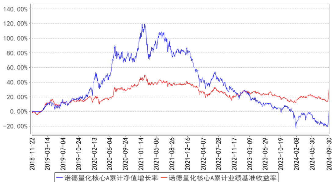
诺德量化核心A累计净值增长率与同期业绩比较基准收益率的历史走势对比图