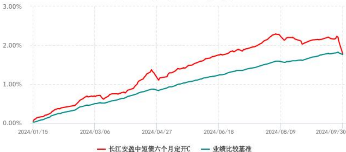
长江安盈中短债六个月定开C累计净值增长率与业绩比较基准收益率历史走势对比图 (2024年01月15日-2024年09月30日)

注：本基金 C 类份额“自基金合同生效以来”的报告期为 2024 年 01 月 15 日至 2024 年 09 月 30 日。