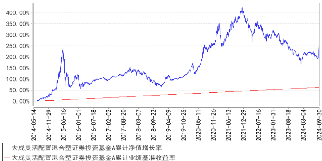
大成灵活配置混合型证券投资基金A累计净值增长率与同期业绩比较基准收益率的历史走势对比图