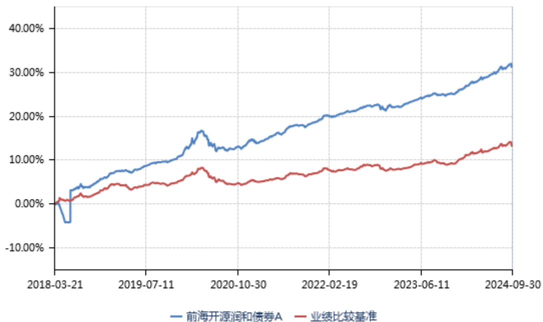
前海开源润和债券 C