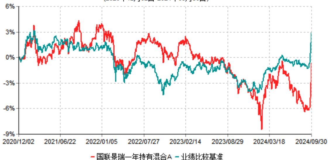
国联景瑞一年持有混合A累计净值增长率与业绩比较基准收益率历史走势对比图 (2020年12月02日-2024年09月30日)