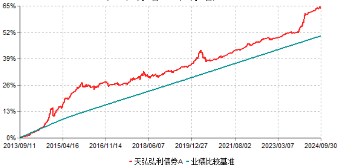
天弘弘利债券A累计净值增长率与业绩比较基准收益率历史走势对比图 (2013年09月11日-2024年09月30日)