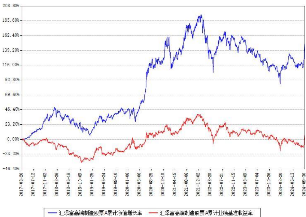
汇添富高端制造股票A累计净值增长率与同期业绩比较基准收益率对比图