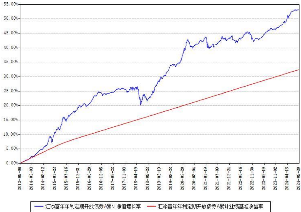
汇添富年年利定期开放债券A累计净值增长率与同期业绩基准收益率对比图