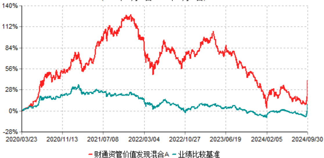
财通资管价值发现混合A累计净值增长率与业绩比较基准收益率历史走势对比图 (2020年03月23日-2024年09月30日)