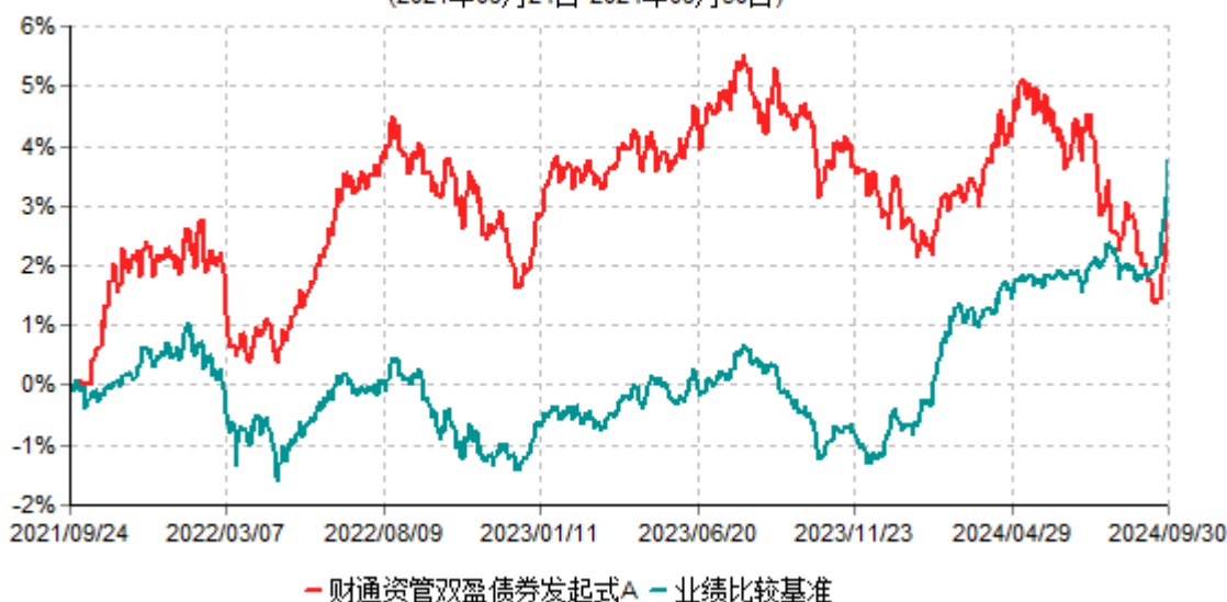
财通资管双盈债券发起式A累计净值增长率与业绩比较基准收益率历史走势对比图 (2021年09月24日-2024年09月30日)