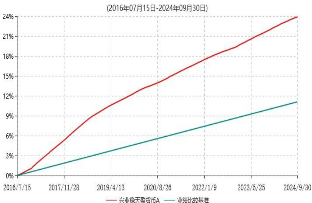
兴业稳天盈货币A累计净值收益率与业绩比较基准收益率历史走势对比图