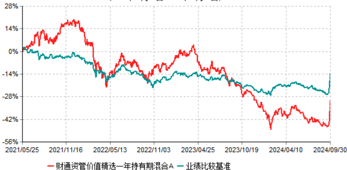
财通资管价值精选一年持有期混合A累计净值增长率与业绩比较基准收益率历史走势对比图 (2021年05月25日-2024年09月30日)