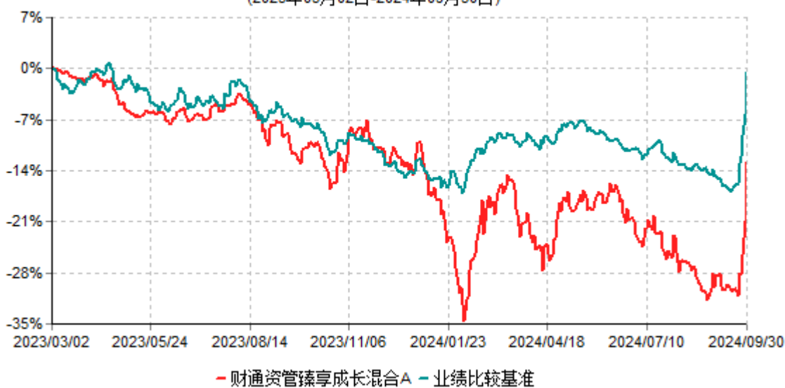
财通资管臻享成长混合A累计净值增长率与业绩比较基准收益率历史走势对比图 (2023年03月02日-2024年09月30日)