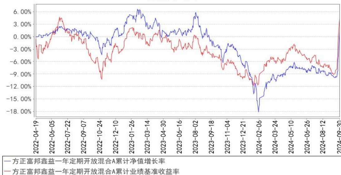
方正富邦鑫益一年定期开放混合A累计净值增长率与同期业绩比较基准收益率的历史走势对比图