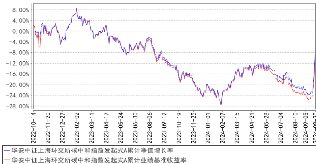
华安中证上海环交所碳中和指数发起式A累计净值增长率与同期业绩比较基准收益率的历史走势对比图