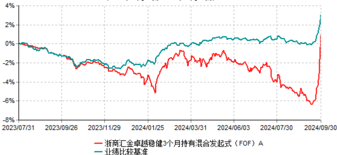
浙商汇金卓越稳健3个月持有混合发起式（FOF）A累计净值增长率与业绩比较基准收益率历史走势对比图 (2023年07月31日-2024年09月30日)

注：本基金的基金合同生效日为2023年07月31日。至本报告期末，本基金已完成建仓，但报告期末距建仓结束不满一年，建仓期为2023年07月31日-2024年01月30日，本基金建仓期结束时各项资产配置比例符合合同的约定。