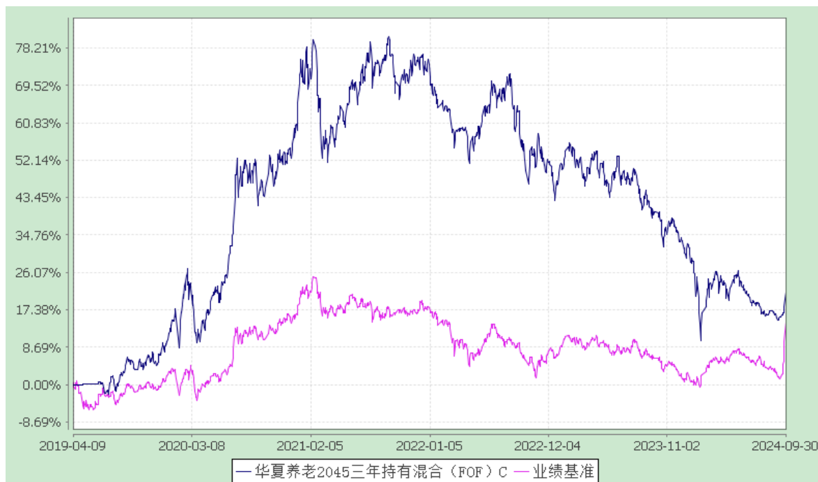
华夏养老 2045 三年持有混合（FOF）Y：