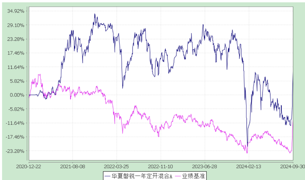
华夏磐锐一年定开混合 C: