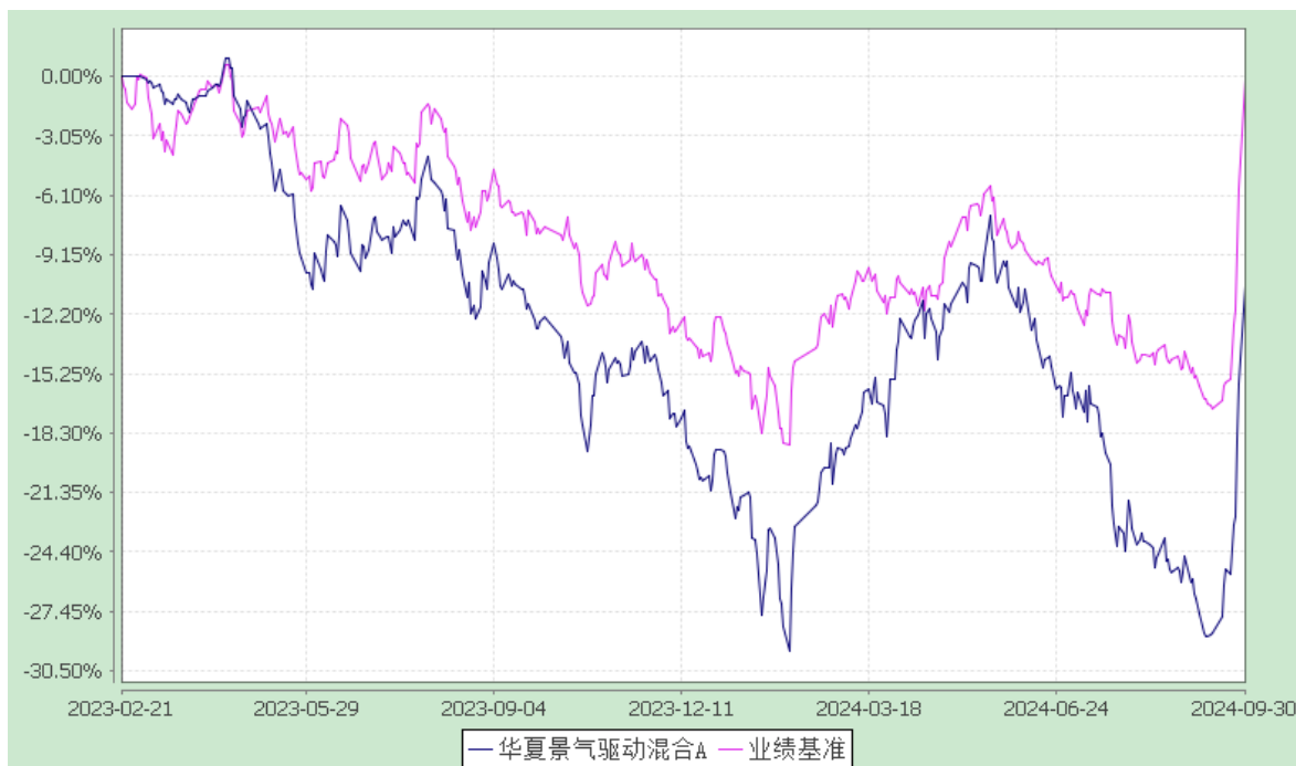
华夏景气驱动混合 C: