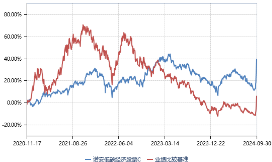
诺安低碳经济股票 D