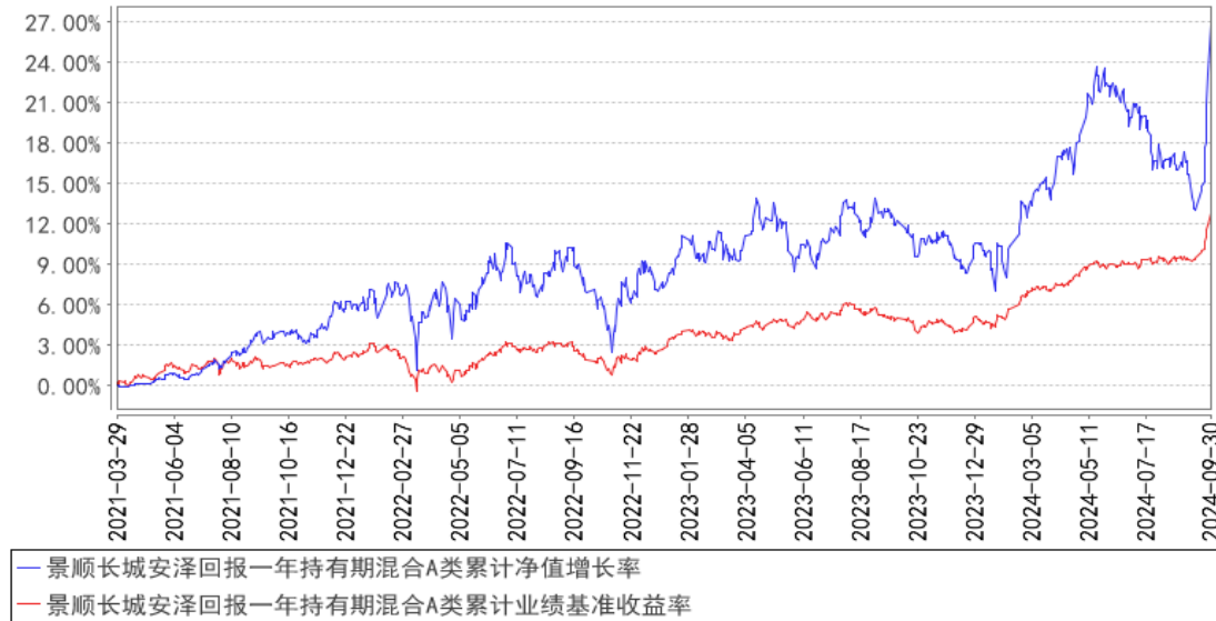
景顺长城安泽回报一年持有期混合A类累计净值增长率与同期业绩比较基准收益率的历史走势对比图