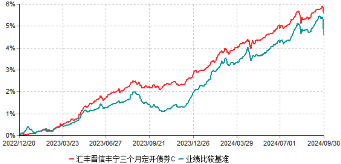
汇丰晋信丰宁三个月定开债券C累计净值增长率与业绩比较基准收益率历史走势对比图 (2022年12月20日-2024年09月30日)