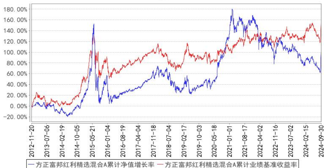
方正富邦红利精选混合A累计净值增长率与同期业绩比较基准收益率的历史走势对比图