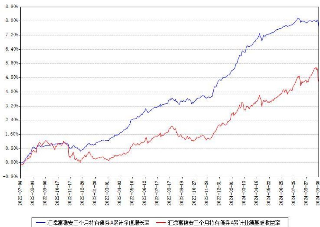
汇添富稳安三个月持有债券A累计净值增长率与同期业绩比较基准收益率对比图