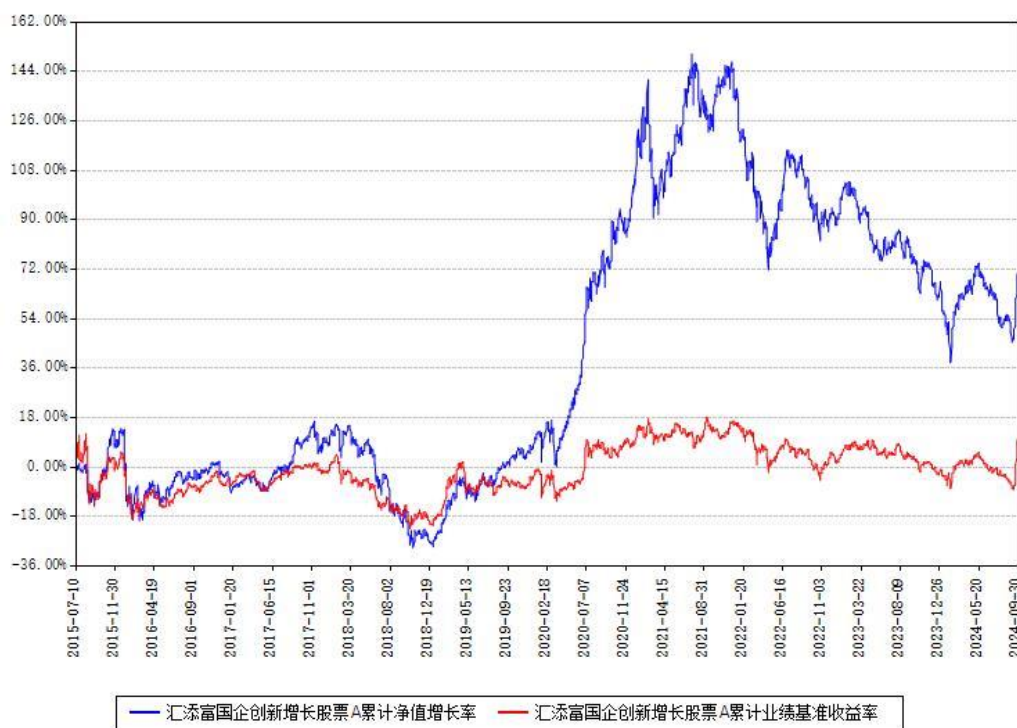
汇添富国企创新增长股票A累计净值增长率与同期业绩基准收益率对比图