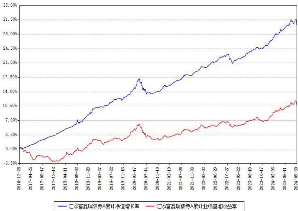
汇添富鑫瑞债券A累计净值增长率与同期业绩基准收益率对比图