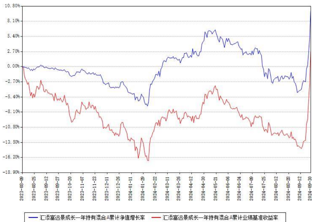
汇添富远景成长一年持有混合C累计净值增长率与同期业绩基准收益率对比图