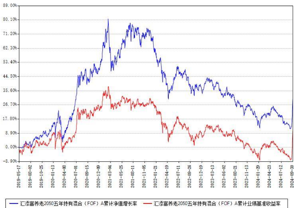
汇添富养老2050五年持有混合（FOF）Y累计净值增长率与同期业绩比较基准收益率对比图