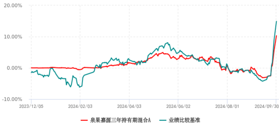
泉果嘉源三年持有期混合A累计净值增长率与业绩比较基准收益率历史走势对比图 (2023年12月05日-2024年09月30日)