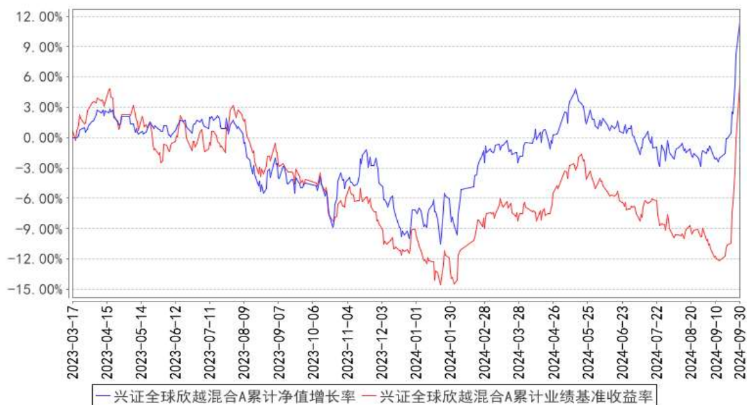
兴证全球欣越混合A累计净值增长率与同期业绩比较基准收益率的历史走势对比图