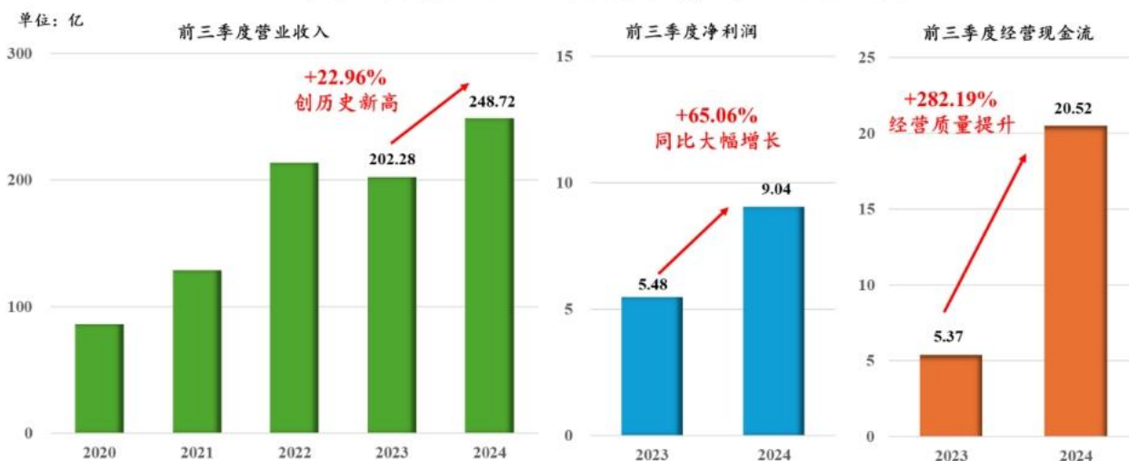
公司前三季度营业收入创历史新高，净利润大幅增长

2024 年前三季度，核心产品的产能开工率均在 95% 以上，各项核心产品大幅增长，毛利率稳中有升，进一步彰显在本轮全球行业产能竞争中，公司持续精准预判行业需求，理性推动产能扩张，产能利用率高，成为公司在新一轮全球行业竞争中的强大优势。