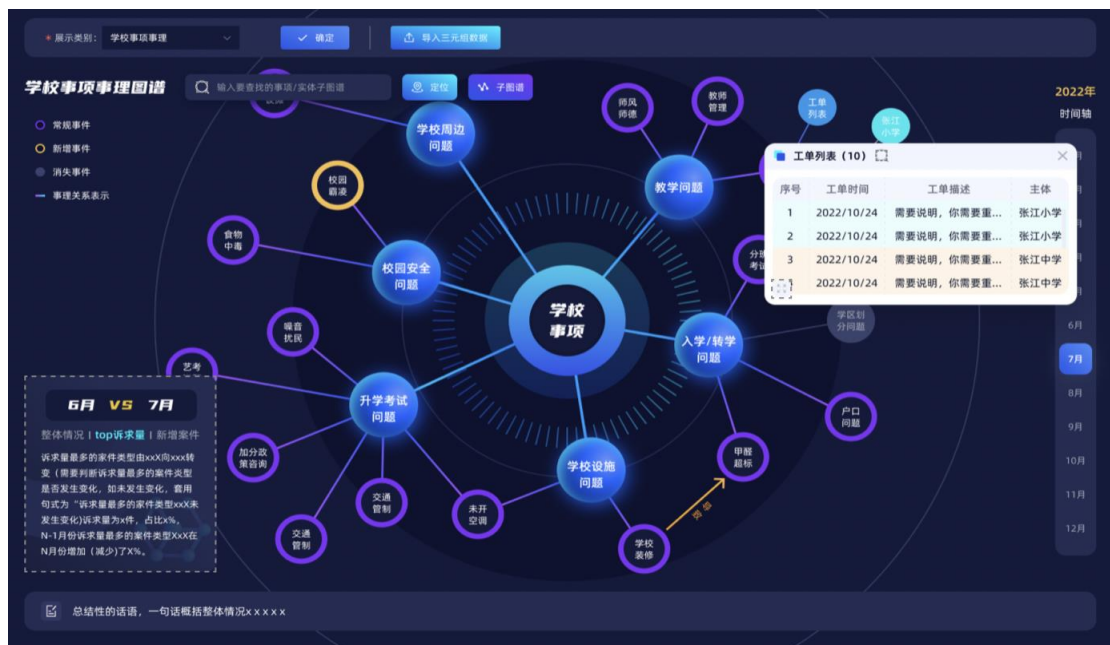
图 3 现有知识图谱应用示例图（公司内部应用）

“知识增强智能引擎”项目，将通过各类增强引擎建设，添加更多知识图谱以外的业务逻辑（如数理知识逻辑、知识节点匹配逻辑等），实现对客户数据的整合、抽取、对标、推理，降低客户使用门槛，使得产品可以从“专家使用”