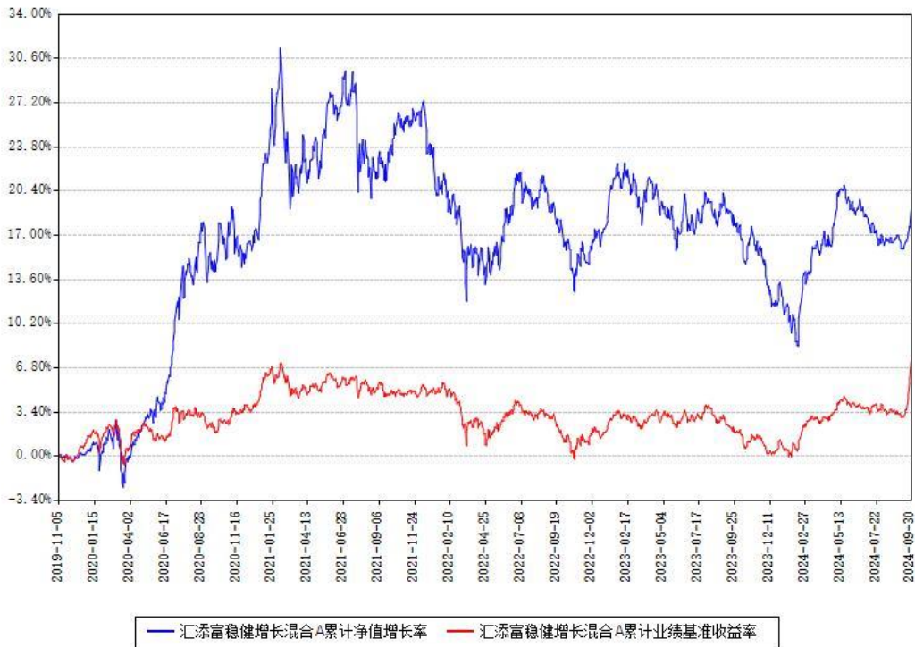
汇添富稳健增长混合A累计净值增长率与同期业绩基准收益率对比图