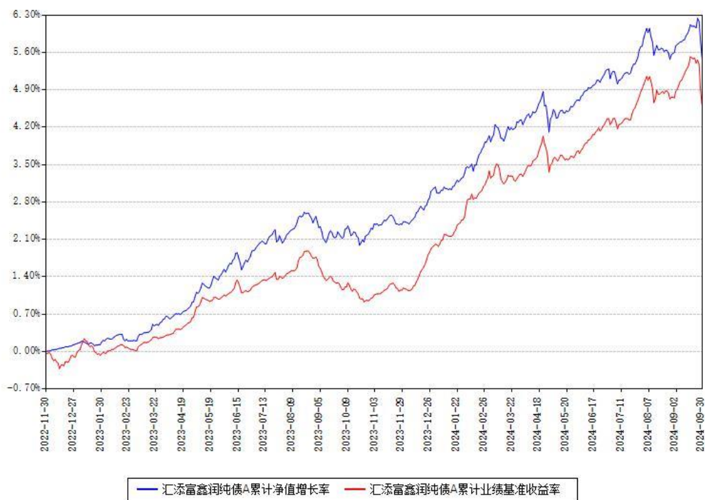
汇添富鑫润纯债A累计净值增长率与同期业绩基准收益率对比图

(二) 自基金合同生效以来基金累计净值增长率变动及其与同期业绩比较基准收益率变动的比较图