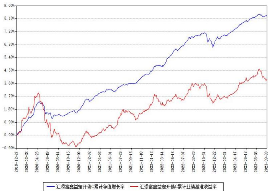
汇添富鑫益定开债C累计净值增长率与同期业绩基准收益率对比图