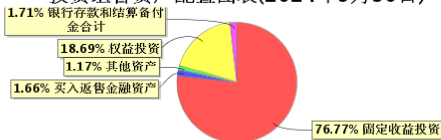
投资组合资产配置图表(2024年9月30日)

● 固定收益投资 ● 买入返售金融资产 ● 其他资产 ● 权益投资 ● 银行存款和结算备付金合计