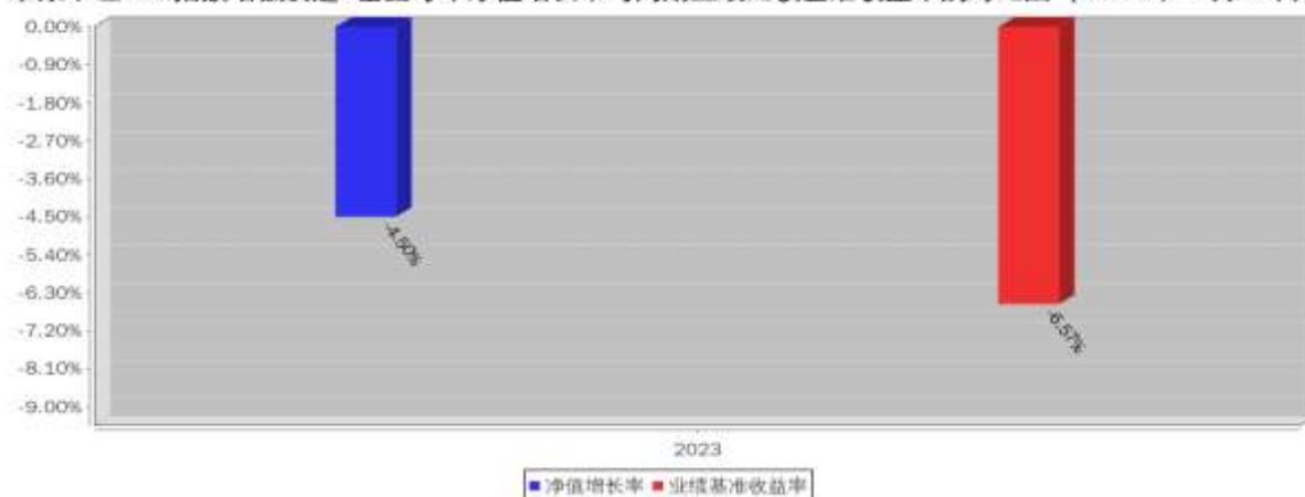
泰康中证500指数增强发起A基金每年净值增长率与同期业绩比较基准收益率的对比图（2023年12月31日）

注：本基金成立于 2023 年 8 月 17 日，2023 年度相关数据的计算期间为 2023 年 8 月 17 日至 2023 年 12 月 31 日，图示业绩表现截止日期 2023 年 12 月 31 日。基金过往业绩不代表未来表现。