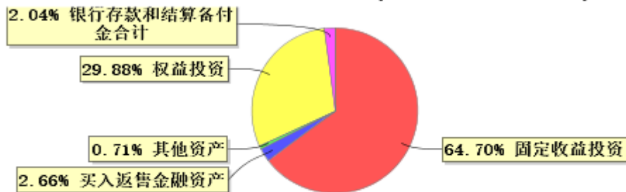
投资组合资产配置图表(2024年9月30日)