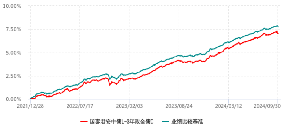
国泰君安中债 1-3 年政金债 C 累计净值增长率与业绩比较基准收益率历史走势对比图 (2021 年 12 月 28 日-2024 年 09 月 30 日)