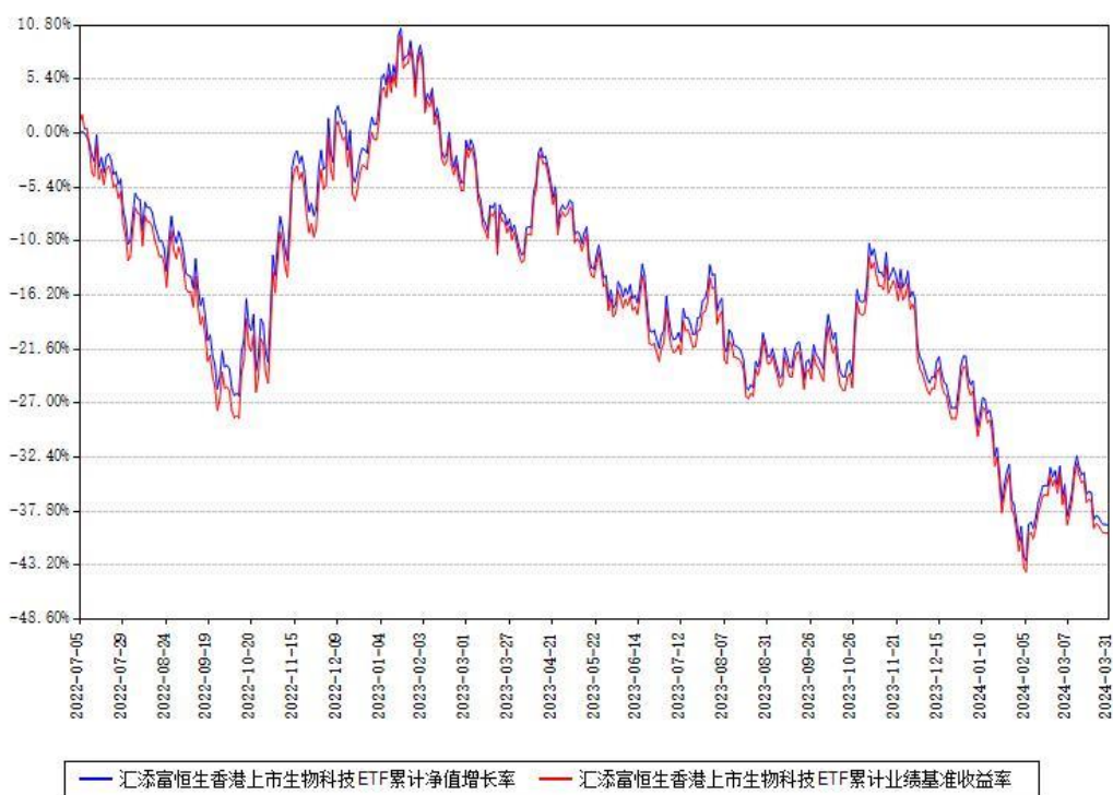
汇添富恒生香港上市生物科技ETF累计净值增长率与同期业绩基准收益率对比图